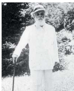
▲ Il fondatore Camillo Olivetti fondò l'Ico (Ingegnere Camillo Olivetti), sigla a cui si ispira anche "Icona"